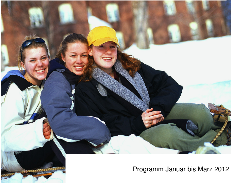
Programm Januar bis März 2012